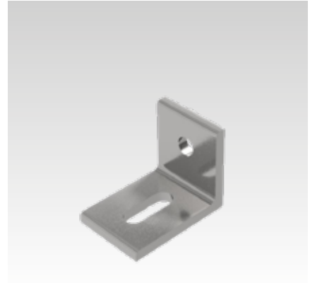
Winkel für Luftmischkasten, Pos. 12