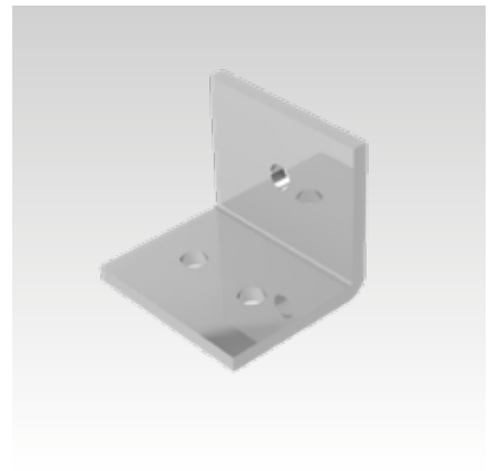
Winkel für Kanalhalter, Pos. 15