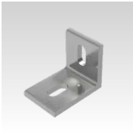
Winkel für Luftmischkasten, Pos. 13