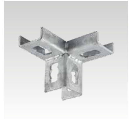
MPR-Eckverbinder links Typ S+1