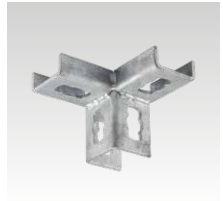
MPR-Eckverbinder rechts Typ S+1