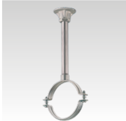
Montage als Festpunkt mit Rohrnickel und Schraubrohrscheelle mit Rohrgewindeanschluss

Dieses Produkt wurde mit dem „Gütezeichen Rohrbefestigung“ ausgezeichnet und unterliegt der Fremdüberwachung nach RAL-GZ 655-B