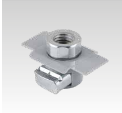
MPR-Schnellbefestiger-Adapter für schwere Baureihe