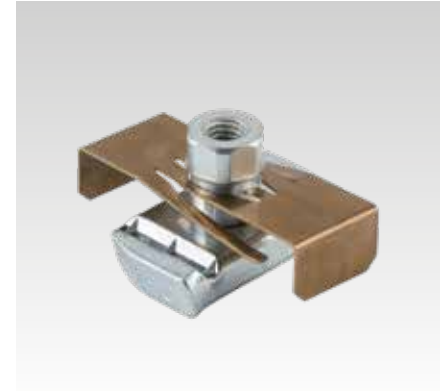
MPR-Schnellbefestiger-Adapter für leichte Baureihe