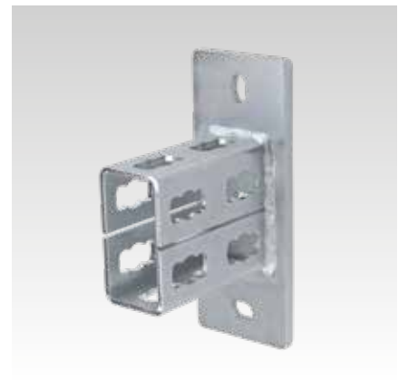
MPR-Sattelflansch Typ S+ für Profil 41/82 und 41/124