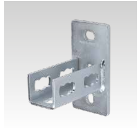
MPR-Sattelflansch Typ S+ für Profil 41/41 und 41/62