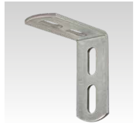
Montagewinkel 90°, Typ 3, leicht