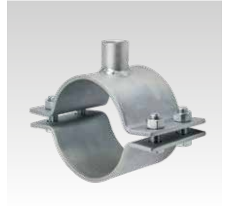
Festpunktschelle 120 x 6