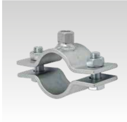
Festpunktschelle 60 x 6